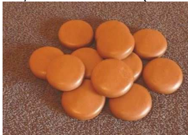
Kit 12 pierres froides supplémentaires tarif indicatif 30€

Afin de pouvoir mettre en pratique ce que vous avez appris à l'issue de certaines formations, il vous appartiendra d'acquérir du matériel spécifique détaillé ci-dessous. Ce matériel pourra être acquit sur place le jour de la formation, ou inclut dans le tarif de formation, suivant la session (voir contrat d'inscription)