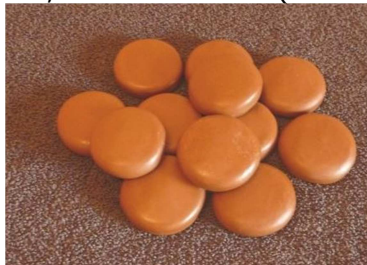
Kit 12 pierres froides supplémentaires tarif indicatif 30€

Afin de pouvoir mettre en pratique ce que vous avez appris à l'issue de certaines formations, il vous appartiendra d'acquérir du matériel spécifique détaillé ci-dessous. Ce matériel pourra être acquit sur place le jour de la formation, ou inclut dans le tarif de formation, suivant la session (voir contrat d'inscription)