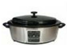
unité chauffante 6 litres prévoir entre 80 et 150€

Les massages du pack débutant utilisant des pierres d'argiles chaudes nécessitent du matériel spécifique pour leur pratique : Attention, les protocoles massage douceur aux pierres d'argile chaudes et spécial dos sont des exclusivités AFSCI. Ils se pratiquent uniquement avec des pierres d'argile, pas des pierres en basalte.