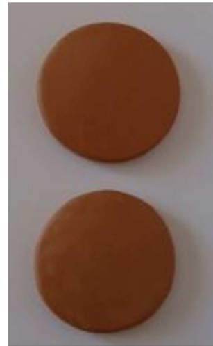
2 pierres Taille 1 complémentaires pour spécial dos Tarif indicatif : 10€ (tarif au 01/09/2022) En vente sur place le jour de la formation