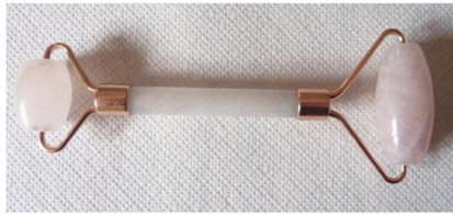
2 rollers visage en quartz rose à 14.50 € la piece

Matériel spécifique a certains module qu'il vous appartiendra d'acquérir pour votre pratique personnelle