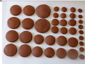
kit 39 pierres d'argile

https://www.ludion-massage.com/petite-etuve-p-66.html