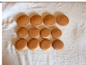
kit pierres 12 d'argile spécial dos Prix indicatif 50€ ou 2 pierres complémentaires Taille 1 au kit 39 pierres du massage douceur (en cas de pack débutant niveau1) Sur commande à AFSCI